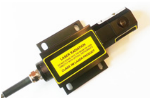
Trucklaser modell TRC6